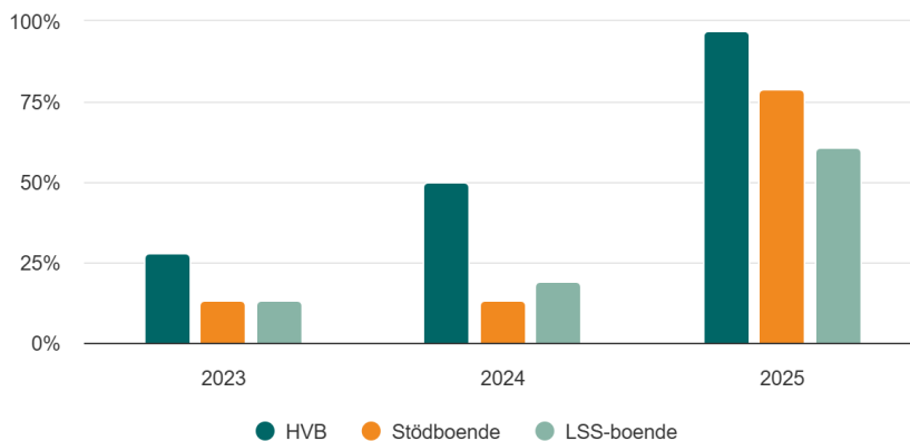
Figur 1. Andel oanmälda inspektioner i den årliga tillsynen av boenden för barn och unga 2023 – augusti 2025